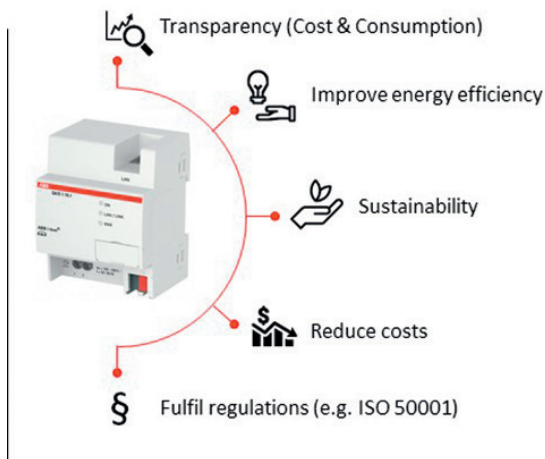
La gamma di prodotti EQmatic di ABB

Inoltre, altri valori come la temperatura, la concentrazione di CO 2 e l'umidità possono essere registrati e visualizzati sotto forma di grafico, per esempio, per ottimizzare la ventilazione delle stanze. Oltre a KNX, il QA / S ha anche interfacce M-Bus e Modbus.