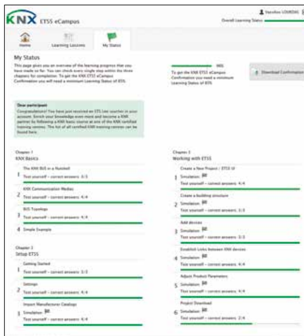
Blijf gemotiveerd door zelf je vooruitgang in het leerproces te testen

voldaan. Maar eerst moet hij leren over de parametering van de functies van de busdeelnemers – de zogenaamde finishing touches –, zodat de individuele busdeelnemers kunnen uitgroeien tot een geïntegreerd automatiseringssysteem. Ten slotte wordt de projectsoftware geladen in de genetwerkte hardware en wordt het systeem in gebruik genomen – het project is dan voltooid.