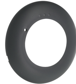
Abdeckring PD2N DE Art.No: 93771

Batterie: 3.0 V Lithium CR2032 (inklusive) Abmessungen: 57 x 35 x 7 mm Farbe: -