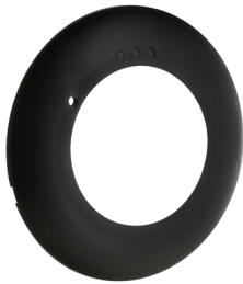
Abdeckring PD2N DE Art.No: 93773

Abmessungen: 40 x 55 x 103 mm Farbe: schwarz Frequenz: 2.4 GHz ISM-Band, GFSK 0.2 dBm + 5.3 dBi = 5.5 dBm