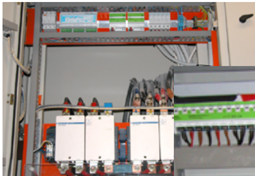
Energieverteilung mit Überwachungs- und Messeinrichtung über EIB/KNX