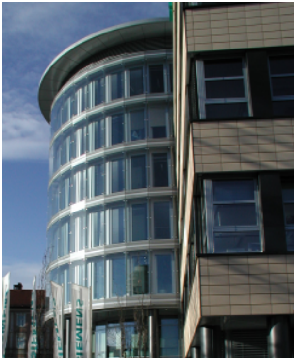
Die gläserne Rotunde als Kennzeichen des Bürogebäudes Einstein 3

Im Stadtteil Haidhausen von München wurde im Jahre 2000 das neue Bürogebäude Einstein 3 fertiggestellt. Das Gebäude bietet 32.000 m 2 Büro- und Gewerbeflächen an attraktiver Lage. Unverwechselbares Kennzeichen ist