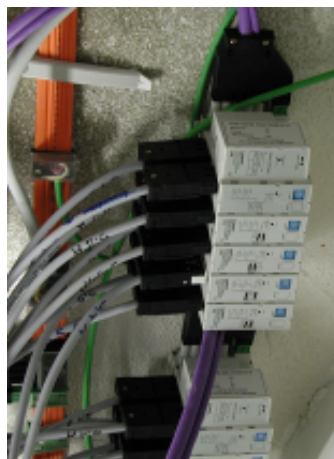
Reihenaktoren für Beleuchtung und Jalousien

• Einsatz von Reihenaktoren für Beleuchtungs- und Jalousiesteuerung. Die Ein- und Ausgänge sind steckbar. Nur die Kopfstation enthält einen EIB-Busankoppler, welche alle Daten zum EIB-Netzwerk kommuniziert. Dies ermöglichte eine rationelle, vorgefertigte Installation, zumal zusätzlich ein kombiniertes Flachkabel für Energie und Bus eingesetzt wurde.