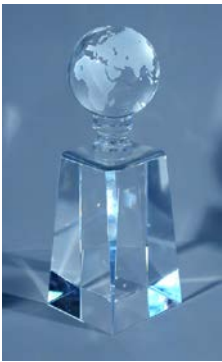
Foto 2: De winnaar van elke categorie zal daarenboven de felbegeerde KNX-trofee in ontvangst mogen nemen.

KNX Associatie is de oprichter en eigenaar van de KNX technologie - de wereldwijd enige open STANDAARD voor alle toepassingen voor de huis- en gebouwenautomatisering. Dit houdt zowel de besturing in van gebouwgebonden installaties zoals verlichting, zonwering, verwarming, ventilatie, airconditioning, beveiliging, persoonlijke alarmering, watercontrole, energiebeheer en energiemeters, telecommunicatie als consumentenelektronica in. KNX is wereldwijd de enige standaard voor huis- en gebouwenautomatisering: Een fabrikant- en productonafhankelijk ingebruiksstellingstool (ETS). Een volledige serie van transmissiemedia (TP, PL, RF en IP). Een volledige serie configuratiemodi (system and easy mode). KNX is erkend als: Europese Standaard (CENELEC EN 50090 en CEN EN 13321-1) en Internationale Standaard (ISO/IEC 14543-3). Deze standaard is gebaseerd op meer dan 19 jaar ervaring in de markt, de voorgangers EIB, EHS en BatiBUS inbegrepen. Meer dan 250 bedrijven wereldwijd zijn lid van de vereniging en bieden bijna 7000 KNX gecertificeerde productgroepen in hun catalogi aan. KNX Associatie heeft met meer dan 30.000 installatiebedrijven partnerovereenkomsten in bijna 100 landen.