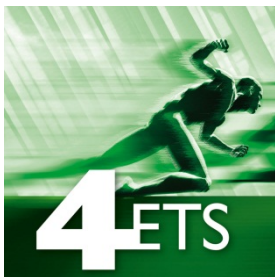
Image 1: Un démarrage fructueux avec ETS4 grâce au eCampus ETS de KNX

temps ou à dépenser de l'argent. Le eCampus est aussi la meilleure préparation pour visiter l'un de nos 200 centres de formation KNX situés dans plus de 35 pays. Le eLearning ETS de KNX est basé sur un système de gestion de l'apprentissage orienté objet qui a été essayé et testé partout dans le monde. Le concept d'apprentissage a deux niveaux, comprenant le transfert des connaissances ETS4 et la pratique des exercices de simulation en ligne et a été élaboré en consultation avec des instances de formation KNX certifiées. Il est donc guidé selon des pratiques qui se sont à ce jour couronnées de succès. Il sera disponible en «anglais» et «allemand» dès Novembre 2011 et d'autres langues seront également disponibles à une date ultérieure ( www.knx.org )