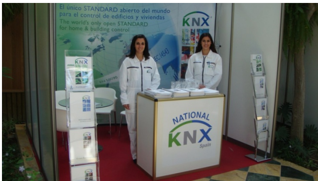
En la zona expo se establecieron los contactos entre los expositores y los profesionales que acudieron al evento.

En la zona expo mostraron las empresas ABB, Dicomat-Wago, Gewiss, Guijarro Hermanos, Hager, Intesis, Jung Ibérica, Schneider Electric, Siemens, Woertz sus productos, soluciones y servicios relacionados con el control y la automatización en edificios.