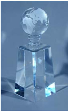
Foto 2: De winnaar van elke categorie zal daarenboven de felbegeerde KNX-trofee in ontvangst mogen nemen.

KNX Associatie is de oprichter en eigenaar van de KNX technologie - de wereldwijd enige open STANDAARD voor alle toepassingen voor de huis- en gebouwenautomatisering. Dit houdt zowel de besturing in van gebouwgebonden installaties zoals verlichting, zonwering, verwarming, ventilatie, airconditioning, beveiliging, persoonlijke alarmering, watercontrole, energiebeheer en energiemeters, telecommunicatie als consumentenelektronica in. KNX is wereldwijd de enige standaard voor huis- en gebouwenautomatisering: Een fabrikant- en productonafhankelijk ingebruikstellingstool (ETS). Een volledige serie van transmissiemedia (TP, PL, RF en IP). Een volledige serie configuratiemodi (system and easy mode). KNX is erkend als: Europese Standaard (CENELEC EN 50090 en CEN EN 13321-1) en Internationale Standaard (ISO/IEC 14543-3). Deze standaard is gebaseerd op meer dan 19 jaar ervaring in de markt, de voorgangers EIB, EHS en BatiBUS inbegrepen. Meer dan 175 bedrijven wereldwijd zijn lid van de vereniging en bieden bijna 7000 KNX gecertificeerde productgroepen in hun catalogi aan. KNX Associatie heeft met meer dan 30.000 installatiebedrijven partnerovereenkomsten in bijna 100 landen.