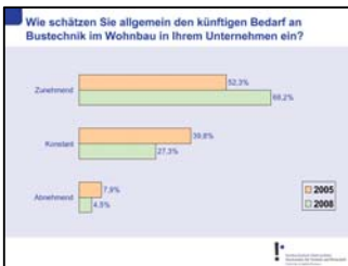
Abb. 4 Nachfrage steigt enorm – Wohnbau holt auf

KNX Association ist der Begründer und Eigentümer der KNX Technologie – des weltweiten STANDARDS für alle Anwendungen im Bereich Haus- und Gebäudesystemtechnik, von der Beleuchtungs- und Rolladensteuerung bis hin zu Sicherheitssystemen, Heizung, Lüftung, Kühlung, Überwachung, Alarm, Wasserregelung, Energiemanagement und Zähler wie auch Haushaltsgeräten, Audio/Video und mehr. KNX ist weltweiter Standard für Haus- und Gebäudesystemtechnik mit einem einzigen hersteller- und produktunabhängigen Inbetriebnahme Tool (ETS), mit einem kompletten Satz von Übertragungsmedien (TP, PL, RF und IP) wie auch einem kompletten Satz von Konfigurationsmodi (Systemmodus und Einfacher Modus). KNX ist als Europäischer Standard (CENELEC EN 50090 und CEN EN 13321-1) und als Internationaler Standard (ISO/IEC 14543-3) anerkannt. Dieser Standard basiert auf 18 Jahren Erfahrung seiner Vorgänger EIB, EHS und BatiBUS. Über 140 Mitgliedsunternehmen weltweit bieten fast 7.000 KNX zertifizierte Produktgruppen in ihren Katalogen an. Die KNX Association hat mit mehr als 30.000 Installationsfirmen in 80 Ländern Partnerschaftsverträge.