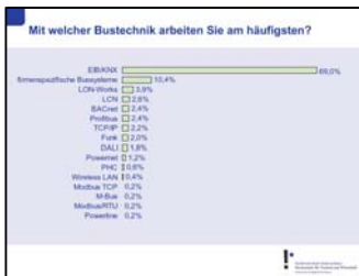
Abb. 3 Übersicht der am häufigsten angewendeten Bustechniken.