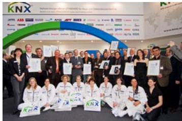
Bild 1: Gewinner des KNX Awards 2008

zur vollsten Zufriedenheit der Feuerwehr und legten damit ihre Abschlussprüfung mit ausgezeichnetem Erfolg ab.