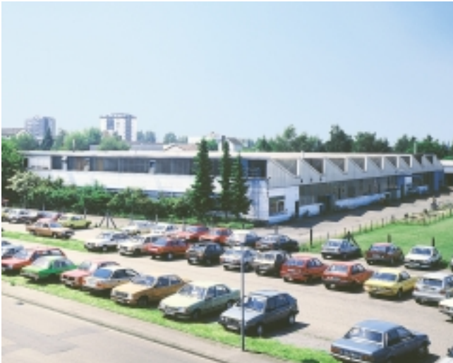
Standort Eppelheim/ Betriebsmittelbau Seestraße 71 69214 Eppelheim Telefon (0 62 21) 701-510