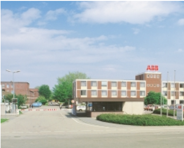
ABB STOTZ-KONTAKT GmbH Standort Heidelberg Eppelheimer Straße 82 (Einfahrt Kurpfalzring) D-69123 Heidelberg-Pfaffengrund Telefon (0 62 21) 701-0