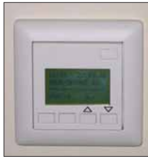
Bild 4. Am Info-Display 2.0 sind Zustandsmeldungen abrufbar

Im Homeserver wurden die Logikfunktionen für die gesamte KNX-Anlage realisiert. Sonst häufig eingesetzte KNX-Logikbausteine im Unterverteiler entfallen dadurch. Die Jalousien werden beispielsweise sonnenstandsabhängig (Zeitprogramme) und helligkeitsgeführt (Helligkeitssensoren) gesteuert. Weitere Funktionen des KNX-Systems sind die Lichtsteuerung über Tastsensoren, Präsenzmelder und Bewegungsmelder, die Alarmanlage sowie das Schalten der Steckdosen. Für die Alarmanlage werden neben Fenster- und Türkon-