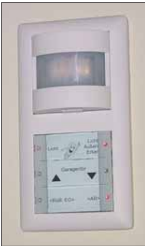
Bild 3. Bewegungsmelder dienen als Sensoren der Lichtsteuerung und der Alarmanlage.

de Aufzeichnung und Visualisierung der Energieverbräuche (Bild 2). Der PC im Arbeitszimmer kann für die zentrale Steuerung dezentraler Funktionen und die Überwachung der gesamten haustechnischen Anlage genutzt werden.