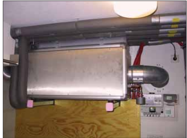
Bild 1. Die Luft/Wasser-Wärmepumpe gewinnt aus der Abluft Energie für die Warmwasserbereitung

Die Steuerung der Heizungs-wärmepumpe erfolgt über einen Homeserver. Hier sind verschiedene Logikfunktionen hinterlegt, die u.a. auch den Kühlbetrieb der Wärmepumpe steuern. So wird im Som-