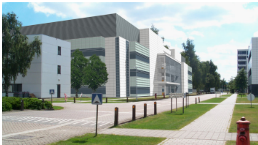
Das neue Forschungs- zentrum von Janssen in Beerse/Belgien

Am Standort Beerse, Belgien, der Pharmazieunternehmung Janssen wurde ein neues Forschungszentrum, das Discovery Research Center (DRC), errichtet. Das Ziel war, neue Methoden einzuführen, welche die Effizienz der Forschung steigern. Das wurde mit flexiblen Einrichtungen und neuen Gebäudestandards erreicht. Die Automationsfirma Egemin realisierte in Zusammenarbeit mit der Ingenieurunternehmung Van Looy mit EIB/KNX und Ethernet ein hochwertiges Gebäude-Managementsystem, das die strengen Vorschriften in der pharmazeutischen Forschung erfüllt.