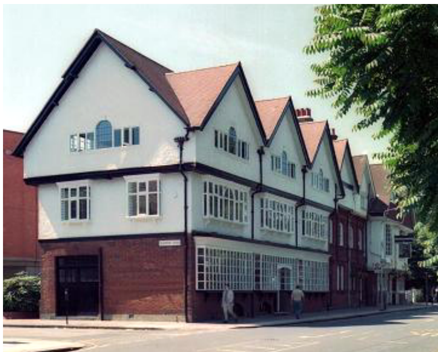
Das historische Gebäude Bath Road 2 in London

Neerveldstraat 105 B - 1200 Brussels www.konnex.org